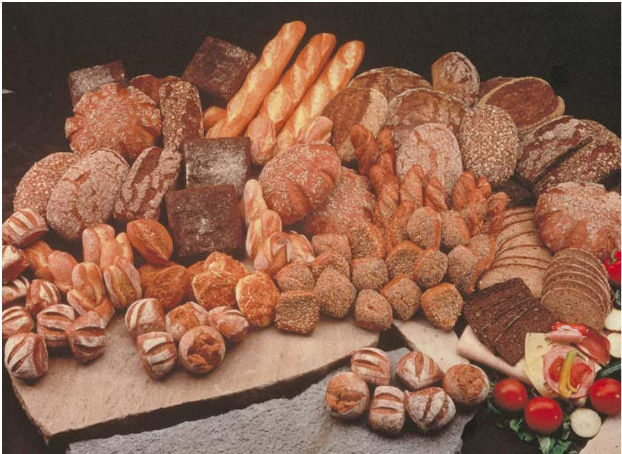
Abbildung 1: Backmittel tragen zur Vielfalt und Qualität unseres Brotes bei

Für die Herstellung eines qualitativ einwandfreien Brotsortimentes benötigt der Backbetrieb aber nicht nur gut backfähige Mahlerzeugnisse, sondern auch weitere Zutaten, die eine störungsfreie Ver- und Bearbeitung sichern. In den vergangenen Jahrzehnten wurden durch die Entwicklung neuer Knetssysteme und Aufarbeitungs- und Formmaschinen erhebliche Fortschritte in der Bäckereitechnologie erzielt. Intensive Knetung und Verformung der Teige führen zu einer Verfeinerung der Krumenbeschaffenheit und zu allgemeiner Steigerung der Gebäckqualität. Die Teige müssen aber in geeigneter Weise maschinenfreundlich gemacht werden.