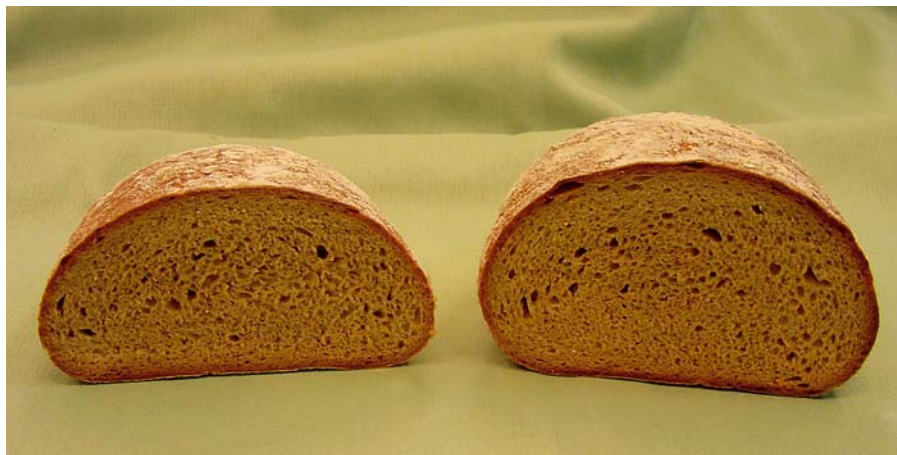
Abbildung 5: Sauerteigbrot ohne Zusatz/ Sauerteigbrot mit stabilisierendem Backmittel

Auf die Quellfähigkeit der Stärke und damit die Wassereinlagerung bzw. Brotfrischhaltung üben verschiedene Salze einen wichtigen Einfluss aus. Es sind das vor allem Calcium-, Natrium- und Kaliumphosphate und Calciumsulfat oder Calciumcarbonat, die dafür in kleinen Mengen verwendet werden. Sie dienen gleichzeitig der Hefe im Teig als Nahrung und fördern damit den Trieb. Dies gilt im Übrigen auch für Malzextrakt, der einerseits bei Weizenbroten zur Geschmacksverbesserung verwendet wird, andererseits bei Schrotbroten die Bindigkeit der Teige erheblich verbessert und im Brot die geschmacklichen Säurespitzen dämpft.