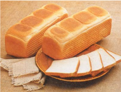
Abbildung 3: Toastbrot

Seit ca. 10 Jahren werden neben Pilz-alpha-Amylasen zunehmend weitere Enzyme eingesetzt, vor allem Pentosanasen, wie z. B. Xylanasen. Sie stabilisieren Teig und Krume, indem sie teilweise unlösliche Pentosane in lösliche Pentosane umwandeln. Diese verbessern die Wassereinlagerung, Wasserbindung, Viskosität und damit die Verarbeitungsfähigkeit der Teige (trockene Teigoberflächen) und letztlich indirekt auch die Frischhaltung. Letztere wird noch durch spezielle Enzyme wie Cellulasen und Hemicellulasen verbessert, die durch partiellen Zellaufschluss die Saftigkeit und Weichheit der Brotkrume erhöhen. Gerade in den letzten Jahren sind derartige „softige“ Brotkrumen zunehmend erwünscht.