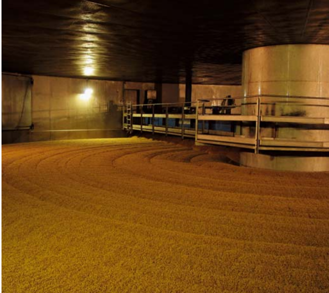
Abbildung 2: Blick in eine Mälzerei (keimendes Getreide)

Dabei spielen Art und Menge der zur Anwendung kommenden Enzymträger eine beachtliche Rolle, da sich die Amylasen je nach Herkunft aus Getreide, Pilzen oder Bakterien in ihrer Wirkungsweise erheblich unterscheiden. Die enzymatisch gebildeten Stärkeabbauprodukte werden nicht vollständig von der Hefe vergoren. Die sog. Maltodextrine sind erwünschte Begleitstoffe, die maßgeblich den Glanz, die Farbe und Rösche der Kruste verstärken und an der Ausbildung des Brotaromas beteiligt sind. Die Hefe braucht zur Vermehrung sowie zur vollen Gärleistung Nährstoffe, die nur zum Teil ausreichend im Mehl vorhanden sind. Durch Zusätze von Calciumsalzen und Phosphaten wird die Gärung stark angeregt und somit die Triebleistung erhöht. Auch die Amylasen werden durch Calciumsalze aktiviert, die daher immer in ausreichender Menge vorhanden sein müssen.